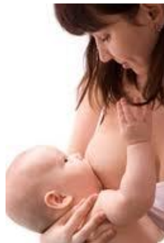
Interaction parent- enfant